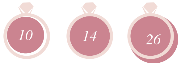
La talla no es correcta La talla es exacta La talla no es correcta

En este ejemplo su anillo se correspondería con la talla 14.